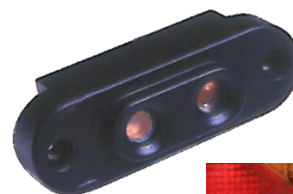
skryte światło konwojowe / hamowania