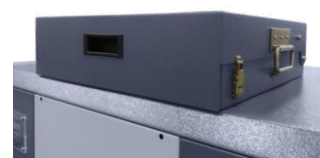
Panel w położeniu zamkniętym